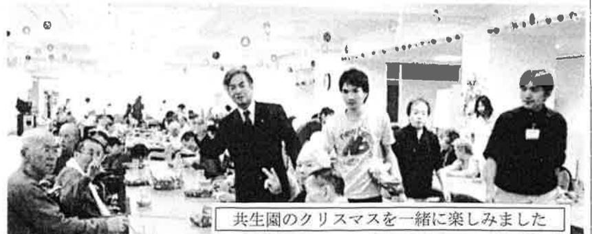
共生園のクリスマスを一緒に楽しみました