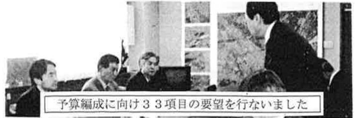
予算編成に向け33項目の要望を行ないました