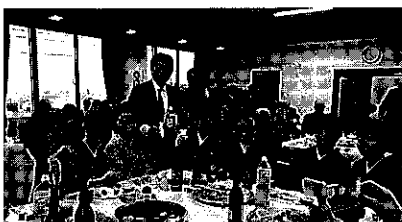
東旭川地区 新春のつどい