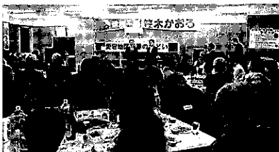
愛宕地区 新春のつどい