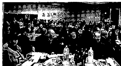
千代田地区 新春のつどい