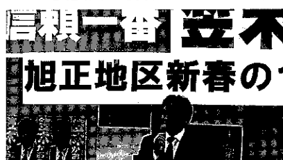
旭正地区 新春のつどい

今年も延べ430名もの皆様にご参加いただきました。準備をいただきました地区役員の皆様、ご参加くださいました皆様に、ただただ、心から感謝申し上げます。